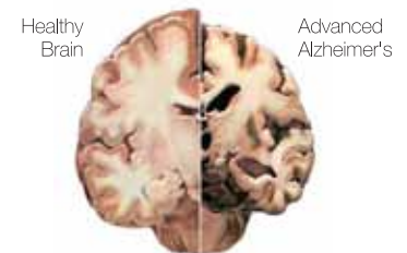
Gambar 2 - Otak normal dan Alzheimer yang telah mengalami penyusutan akibat kematian sel saraf

Kerusakan tersebut dapat menyebabkan kematian sel saraf yang dapat menyebabkan menurunnya fungsi kognitif. Kandungan guarana seperti guaranin, catechin dan (-)-epicatechin bekerja sebagai penghambat enzim monoamine oxidase-B (MAO-B) sehingga mampu mengatasi kerusakan otak dan mencegah penurunan fungsi otak. 2 (Lihat gambar 2)